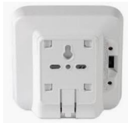
Ei 450 Controle Unit

Voor verdere informatie of vragen kunt u contact met ons opnemen of ons op internet bezoeken.