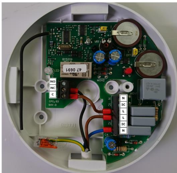
Ei relais 428

Ei 208WRF: CO-melder met RF functie (voeding: batterij, 10-jaars Lithium) Hemmink art. nr. 220924